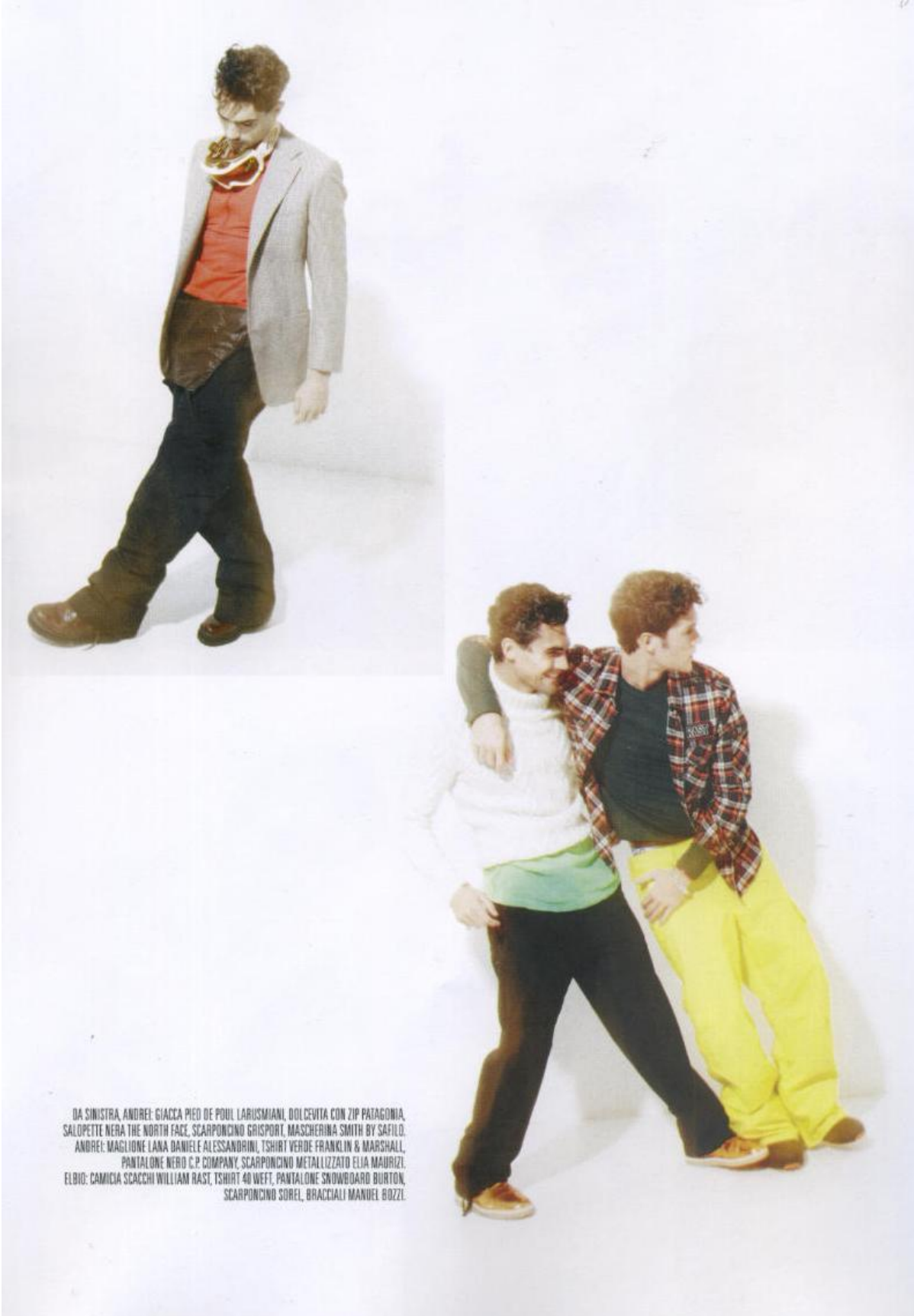
DA SINISTRA, ANDREI: GIACCA PIED DE POUL LARUSMIANI, DOLCEVITA CON ZIP PATAGONIA, SALOPETTE NERA THE NORTH FACE, SCARPONCINO GRISPORT, MASCHERINA SMITH BY SAFILO. ANDREI: MAGLIONE LANA DANIELE ALESSANDRINI, TSHIRT VERDE FRANKLIN & MARSHALL, PANTALONE NERO C.P. COMPANY, SCARPONCINO METALLIZZATO ELIA MAURIZI, ELBIO: CAMICIA SCACCHI WILLIAM RAST, TSHIRT 40 WEFT, PANTALONE SNOWBOARD BURTON, SCARPONCINO SOREL, BRACCIALI MANUEL BOZZI.